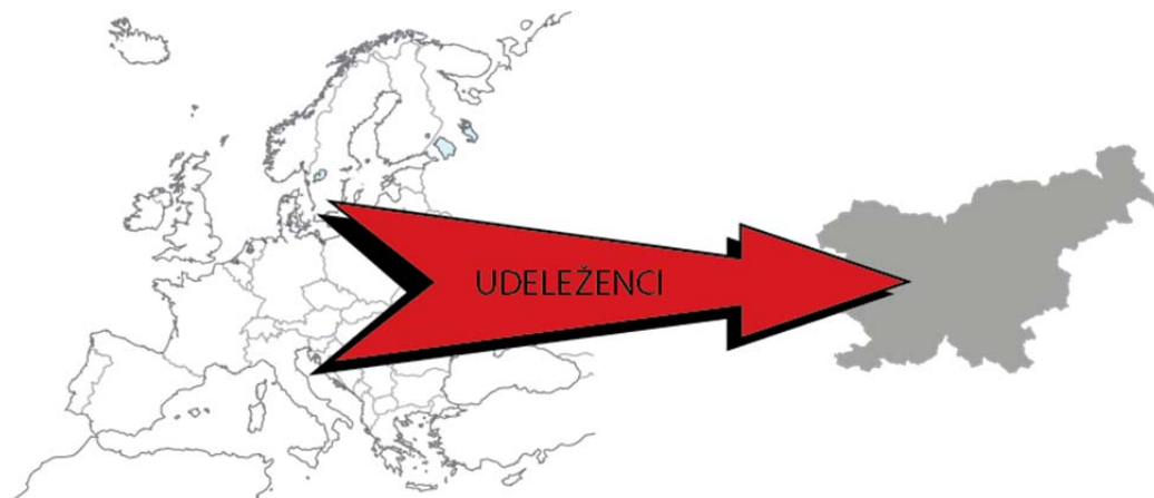
Slika 2: Večina udeležencev naj bi prišla iz drugih držav, ki sodelujejo v programu Vseživljenjsko učenje.

Posebej zaželena je udeležba odraslih iz premalo zastopanih skupin. To so skupine, ki so na različne načine prikrajšane, na primer: