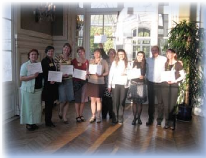
Obiski in izmenjave – udeležba na petem mednarodnem kongresu Attachment, Relational-Needs and Psychotherapeutic Presence

Po uspešno opravljenem zaključnem izpitu sem imela priložnost poslušati predavanja tujih predavateljev na kongresu. Tema je bila zelo zanimiva, pridobljena znanja pa bom poskusila v čim večji meri uporabiti pri svojem delu.