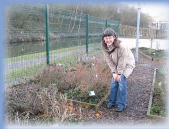
Pripravljani obisk za Učna partnerstva

Drug drugemu smo predstavili dosedanje projekte in načrte, se pogovorili o osnovni ideji skupnega projekta in potencialnih partnerjih. Pregledali smo obrazec prijavnice in določili glavne naloge. Srečanje je bilo tako prijetno, da je bilo nemogoče ločiti delo od druženja. Idej se je nabralo za več projektov. Gotovo jih bomo udeležili kar nekaj, saj si vsi zelo želijo obiskati Slovenijo in naše gore ter morje. Za začetek v projektu F.I.G.E. – Food is Garden Edible .