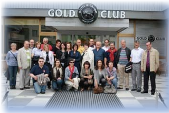
Učna partnerstva – TANDEMS GO!

v njihovi skupnosti in se preizkusili kot prostovoljci v vlogi učiteljev. V projektu smo sodelovali z OŠ Dornberk, ki je k sodelovanju privabila učence in učenke računalniškega krožka, in s skupino starejših odraslih iz društva upokojencev in aktiva podeželskih žena. Sodelovalo je prek 20 prostovoljcev in 6 zaposlenih v naši organizaciji. V partnersko mrežo pa je bilo vključenih 8 evropskih držav. Ob zaključku projekta so izšle tudi tri publikacije, ki so nastajale v sodelovanju s Filozofsko fakulteto, Univerzo za tretje življenjsko obdobje in z vsemi partnerji, ki so prispevali poročila, primere dobrih praks in svoje izkušnje. V tiskani obliki je izšla znanstvena monografija z naslovom Intergenerational Learning and Education in Later Life , v elektronski obliki, prav tako v angleščini, je bila izdana e-knjiga TANDEMS GO! – Twinning the elderly and young people as a possibility of e learning , v slovenščini pa je nastal e-priročnik za medgeneracijsko učenje Izobraževanje – most med generacijami , pri katerem so sodelovali študenti Filozofske fakultete. Vse publikacije so dostopne na spletni povezavi http://www.lu-ajdovscina.si/o_nas/publikacije/ .