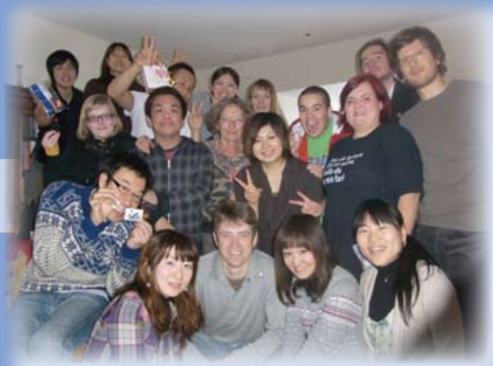
Grundtvig asistenti 'Nordfyns Folkehøjskole'

Aktivnosti, ki sem jih opravljal, so bile: poučevanje angleškega jezika, samostojno izvajanje nekaterih vsebin v mednarodnem programu (milenijski razvojni cilji, vsebine o trajnostnem razvoju itd.), pomoč učiteljem pri delu z mentalno hendikepiranimi osebami, pomoč pri izvajanju športnih vsebin ter wellness programu.