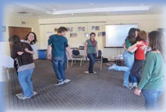
Nadaljnja izobraževanja in usposabljanja – udeležba na tečaju Improving life skills through informal adult learning

Namen in cilji tečaja so bili ponuditi udeležencem teoretična in praktična znanja in izkušnje, ki temeljijo na inovativnih, interaktivnih in kreativnih učnih metodah in pristopih za razvoj veščin, potrebnih za lastno osebnostno rast in za razvoj okolja, ter pridobljeno znanje uporabiti pri delu s skupinami v različnih oblikah neformalnega izobraževanja odraslih. Metode dela so bile naslednje: izkustvene in aktivne učne metode, igre vlog, skupinske delavnice in timsko delo, skupinska in individualna refleksija in dinamika ter PowerPoint predstavitve, kreativno izražanje skozi umetniške, sprostitvene, zabavne in družabne aktivnosti, ogledi in obiski znamenitosti Cipra.