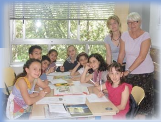
Projekt prostovoljnega dela starejših – Glasba in poezija italijanske in slovenske tradicije

pevski zbori itd. za vse starostne skupine). Glasba in poezija obeh dežel predstavljata vsebinsko rdečo nit projekta. Prostovoljci v gostujoči državi nastopajo kot kulturni ambasadorji ; predstavljajo vsebine s področja glasbe, poezije, zgodovine in jezika svoje dežele po lastnem izboru (skladatelji, pesniki in njihova dela, zgodovina in znamenitosti dežele, posebnosti jezika itd.) ter sodelujejo pri organizaciji in izvedbi drugih dogodkov. Na gostujoči organizaciji se povezujejo s člani, spoznavajo vsebine s področja zgodovine in kulture gostujoče dežele in skupaj iščejo podobnosti in razlike med Slovenijo in Italijo. Ker je jezik projekta italijanščina, je za slovenske prostovoljce dodatni izziv še znanje tujega jezika ter komunikacija v deželi, kjer ne govorijo njihovega maternega jezika. Izbrani prostovoljci so povabilo k sodelovanju sprejeli z veseljem in veliko zavzetostjo.