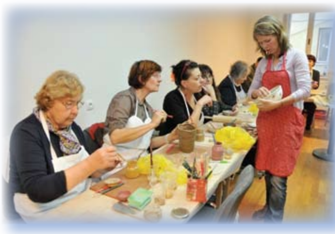
Grundtvig delavnica Sreča in zdravje v glini

V Grundtvig delavnici, ki se je odvijala od 8. do 14. novembra 2010 v Novem mestu, je sodelovala pestra družina 15 starejših odraslih iz 7 različnih držav: Latvije, Nemčije, Poljske, Portugalske, Romunije, Turčije in Slovenije. Glavni del delavnice je bil posvečen oblikovanju uporabnih glinenih izdelkov, ki je udeležence popeljal od osnovnih zakonitosti oblikovanja do zahtevnejših tehnik glaziranja in okraševanja. Dogajanje so popestrili tudi obiski, posvečeni spoznavanju slovenske kulturne dediščine in običajev ob martinovanju: ogled zbirke keramike v Dolenjskem muzeju, Matjaževe domačije na Pahji, moderne izdelave keramike v podjetju Peči keramika in spoznavanje zdravilnih rastlin v samostanu Stična. Vrhunec delavnice je bilo žganje glinenih izdelkov na prostem na turistični kmetiji Pri Malči, kjer so se udeleženci seznanili s posebno japonsko tehniko raku.