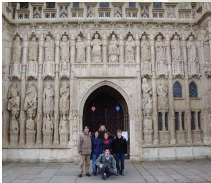
Skupinska slika na izletu v Exeter, Velika Britanija.