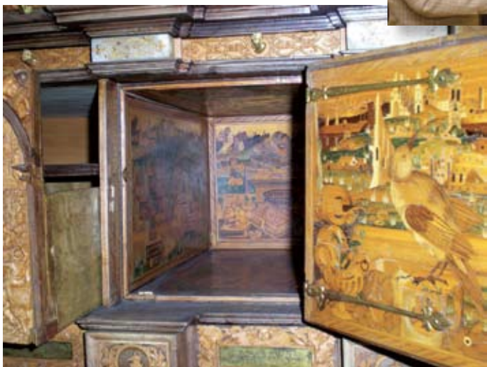
Pobištvo z izjemnim bogastvom furnirskih slik