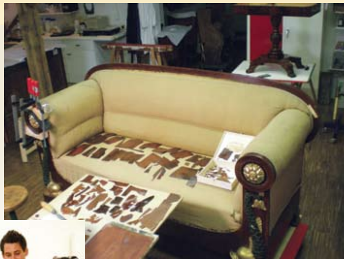
Prilpava furnirja za obnavljanje intarzije