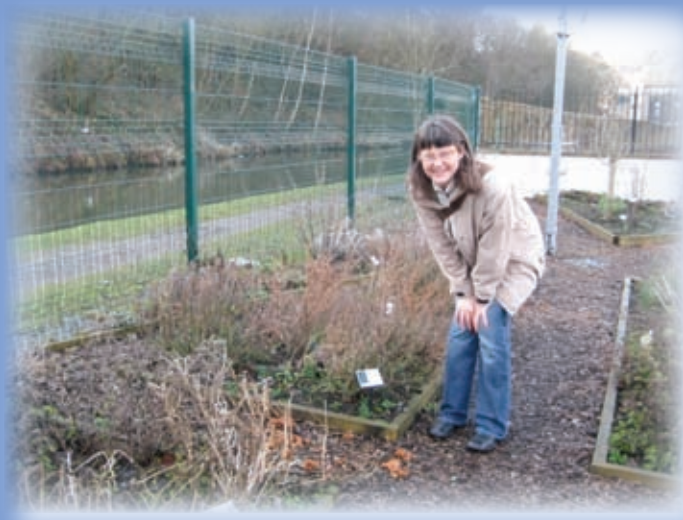
Pripravljani obisk za Učna partnerstva

Drug drugemu smo predstavili dosedanje projekte in načrte, se pogovorili o osnovni ideji skupnega projekta in potencialnih partnerjih. Pregledali smo obrazec prijavnice in določili glavne naloge. Srečanje je bilo tako prijetno, da je bilo nemogoče ločiti delo od druženja. Idej se je nabralo za več projektov. Gotovo jih bomo udeležili kar nekaj, saj si vsi zelo želijo obiskati Slovenijo in naše gore ter morje. Za začetek v projektu F.I.G.E. – Food is Garden Edible .