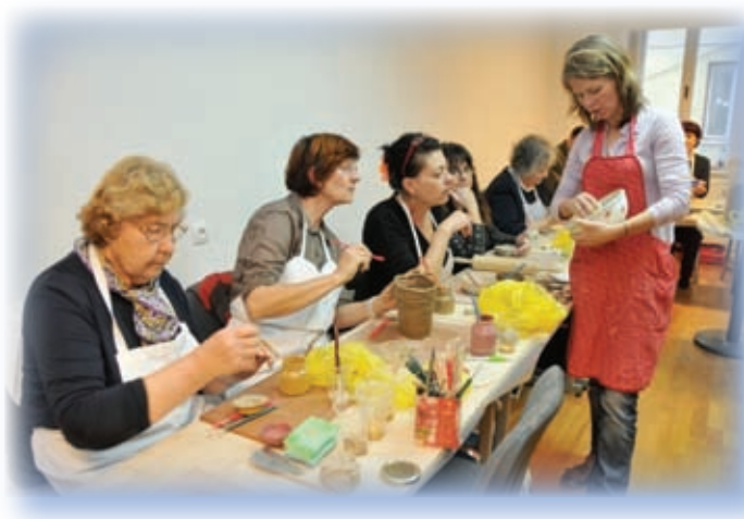
Grundtvig delavnica Sreča in zdravje v glini

V Grundtvig delavnici, ki se je odvijala od 8. do 14. novembra 2010 v Novem mestu, je sodelovala pestra družina 15 starejših odraslih iz 7 različnih držav: Latvije, Nemčije, Poljske, Portugalske, Romunije, Turčije in Slovenije. Glavni del delavnice je bil posvečen oblikovanju uporabnih glinenih izdelkov, ki je udeležence popeljal od osnovnih zakonitosti oblikovanja do zahtevnejših tehnik glaziranja in okraševanja. Dogajanje so popestrili tudi obiski, posvečeni spoznavanju slovenske kulturne dediščine in običajev ob martinovanju: ogled zbirke keramike v Dolenjskem muzeju, Matjaževe domačije na Pahji, moderne izdelave keramike v podjetju Peči keramika in spoznavanje zdravilnih rastlin v samostanu Stična. Vrhunec delavnice je bilo žganje glinenih izdelkov na prostem na turistični kmetiji Pri Malči, kjer so se udeleženci seznanili s posebno japonsko tehniko raku.