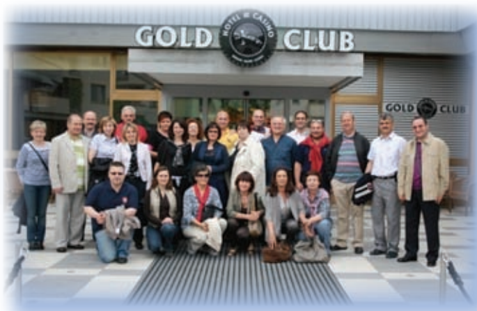
Učna partnerstva – TANDEMS GO!

projektu smo sodelovali z OŠ Dornberk, ki je k sodelovanju privabila učence in učenke računalniškega krožka, in s skupino starejših odraslih iz društva upokojencev in aktiva podeželskih žena. Sodelovalo je prek 20 prostovoljcev in 6 zaposlenih v naši organizaciji. V partnersko mrežo pa je bilo vključenih 8 evropskih držav. Ob zaključku projekta so izšle tudi tri publikacije, ki so nastajale v sodelovanju s Filozofsko fakulteto, Univerzo za tretje življenjsko obdobje in z vsemi partnerji, ki so prispevali poročila, primere dobrih praks in svoje izkušnje. V tiskani obliki je izšla znanstvena monografija z naslovom Intergenerational Learning and Education in Later Life , v elektronski obliki, prav tako v angleščini, je bila izdana e-knjiga TANDEMS GO! – Twinning the elderly and young people as a possibility of e learning , v slovenščini pa je nastal e-priročnik za medgeneracijsko učenje Izobraževanje – most med generacijami , pri katerem so sodelovali študenti Filozofske fakultete. Vse publikacije so dostopne na spletni povezavi http://www.lu-ajdovscina.si/o_nas/publikacije/ .