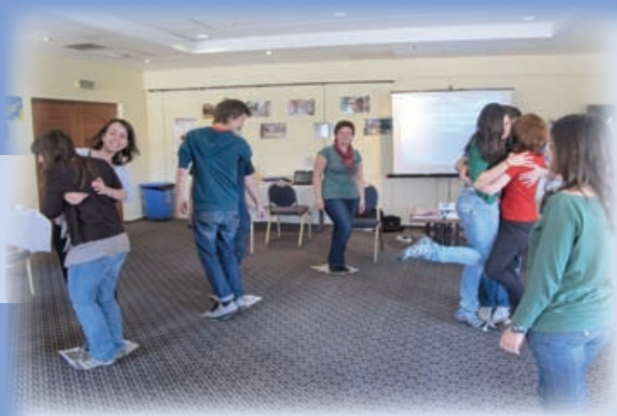
Nadaljnja izobraževanja in usposabljanja – udeležba na tečaju Improving life skills through informal adult learning

Namen in cilji tečaja so bili ponuditi udeležencem teoretična in praktična znanja in izkušnje, ki temeljijo na inovativnih, interaktivnih in kreativnih učnih metodah in pristopih za razvoj veščin, potrebnih za lastno osebno rast in za razvoj okolja, ter pridobljeno znanje uporabiti pri delu s skupinami v različnih oblikah neformalnega izobraževanja odraslih. Metode dela so bile naslednje: izkustvene in aktivne učne metode, igre vlog, skupinske delavnice in timsko delo, skupinska in individualna refleksija in dinamika ter PowerPoint predstavitve, kreativno izražanje skozi umetniške, sprostitvene, zabavne in družabne aktivnosti, ogledi in obiski znamenitosti Cipra.