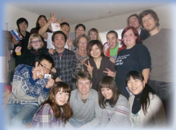
Grundtvig asistenti 'Nordfyns Folkehøjskole'

Aktivnosti, ki sem jih opravljal, so bile: poučevanje angleškega jezika, samostojno izvajanje nekaterih vsebin v mednarodnem programu (milenijski razvojni cilji, vsebine o trajnostnem razvoju itd.), pomoč učiteljem pri delu z mentalno hendikepiranimi osebami, pomoč pri izvajanju športnih vsebin ter wellness programu.