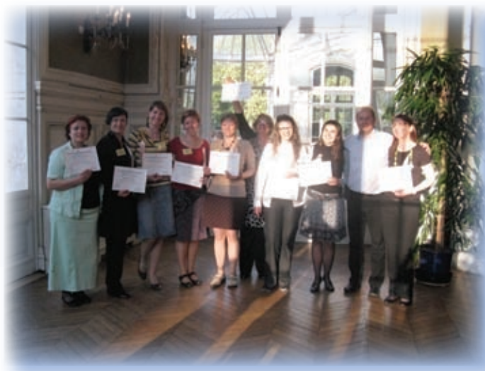
Obiski in izmenjave – udeležba na petem mednarodnem kongresu Attachment, Relational-Needs and Psychotherapeutic Presence

Po uspešno opravljenem zaključnem izpitu sem imela priložnost poslušati predavanja tujih predavateljev na kongresu. Tema je bila zelo zanimiva, pridobljena znanja pa bom poskusila v čim večji meri uporabiti pri svojem delu.