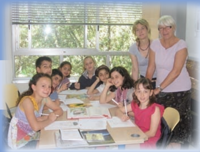
Projekt prostovoljnega dela starejših – Glasba in poezija italijanske in slovenske tradicije

pevski zbori itd. za vse starostne skupine). Glasba in poezija obeh dežel predstavljata vsebinsko rdečo nit projekta. Prostovoljci v gostujoči državi nastopajo kot kulturni ambasadorji ; predstavljajo vsebine s področja glasbe, poezije, zgodovine in jezika svoje dežele po lastnem izboru (skladatelji, pesniki in njihova dela, zgodovina in znamenitosti dežele, posebnosti jezika itd.) ter sodelujejo pri organizaciji in izvedbi drugih dogodkov. Na gostujoči organizaciji se povezujejo s člani, spoznavajo vsebine s področja zgodovine in kulture gostujoče dežele in skupaj iščejo podobnosti in razlike med Slovenijo in Italijo. Ker je jezik projekta italijanščina, je za slovenske prostovoljce dodatni izziv še znanje tujega jezika ter komunikacija v deželi, kjer ne govorijo njihovega maternega jezika. Izbrani prostovoljci so povabilo k sodelovanju sprejeli z veseljem in veliko zavzetostjo.