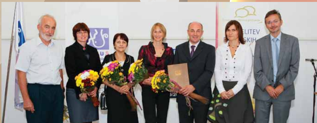
Podelitev Nacionalnih jezikovnih priznanj, Slovenski šolski muzej, Ljubljana, 26. 9. 2011.