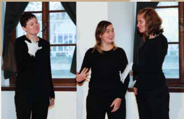
Nastop Zveze društev gluhih in naglušnih Slovenije na podelitvi Evropskih in Nacionalnih jezikovnih priznanj 2009 na Gradu Fužine

Osnovna aktivnost, ki je vodila k začetku projekta, je bila združitev dosedanjih oblik predstavitve slovenskega znakovnega jezika, to je knjig Govorica rok I in Govorica rok II ter ostalih virov v računalniški program za multimedijski didaktični pripomoček za učenje in poučevanje slovenskega znakovnega jezika.