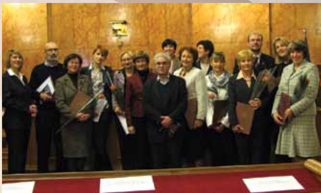
Podelitev Evropskih jezikovnih priznanj Univerza v Ljubljani, 18. 12. 2006