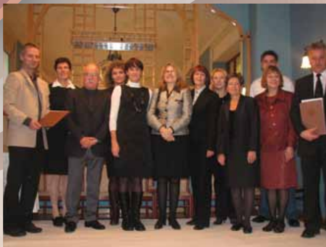
Podelitev Evropskih jezikovnih priznanj, Grand hotel Union, Ljubljana, 2. 12. 2008