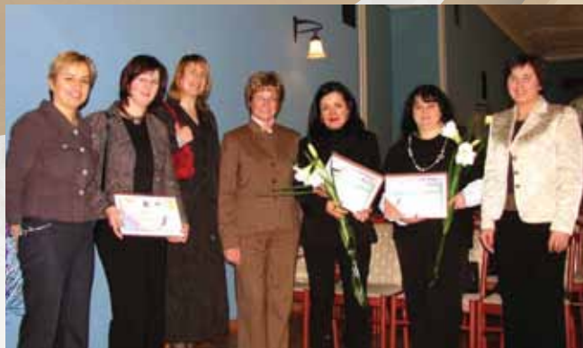
Podelitev Evropskih jezikovnih priznanj, Grand hotel Union, Ljubljana, 19. 12. 2007

Triletni projekt Centra za slovenščino kot drugi/tuji jezik z naslovom »Slavic Networking – jezikovna in kulturna integracija« popolnoma ustreza evropski prioriteti za leto 2007, to je večanje ponudbe jezikov in jezikovne raznolikosti. Slovanski jeziki, ki so bili vključeni v omenjeni projekt (slovenščina, slovaščina, češčina, poljščina in bolgarščina), sodijo vsekakor med manj razširjene jezike oziroma jezike, ki si svoje mesto v Evropski uniji šele izgrajujejo.