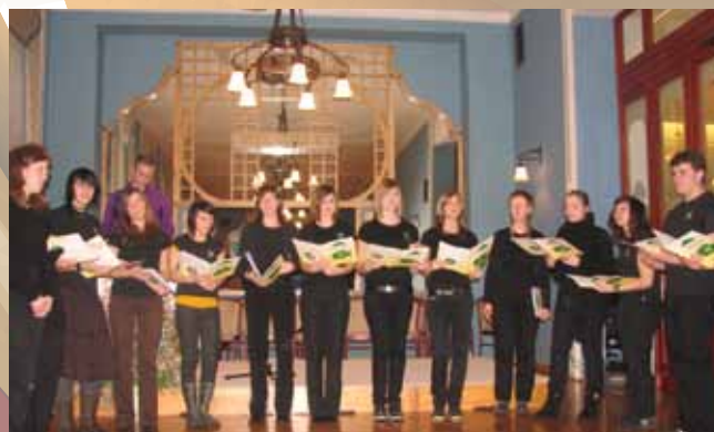
Podelitev Evropskih jezikovnih priznanj, Grand hotel Union, Ljubljana, 2. 12. 2008

Prav tako je nastala nova spletna stran s prosto dostopnim jezikovnim tečajem, ki poleg jezikovnih struktur in besedišča vključuje tudi kulturne elemente posamezne jezikovne skupnosti in značilne dejavnike nebesedne komunikacije. Stran je primerna za samostojno učenje, portal pa omogoča širšo izmenjavo izkušenj vseh, ki delujejo na področju gastronomije in hotelirstva.