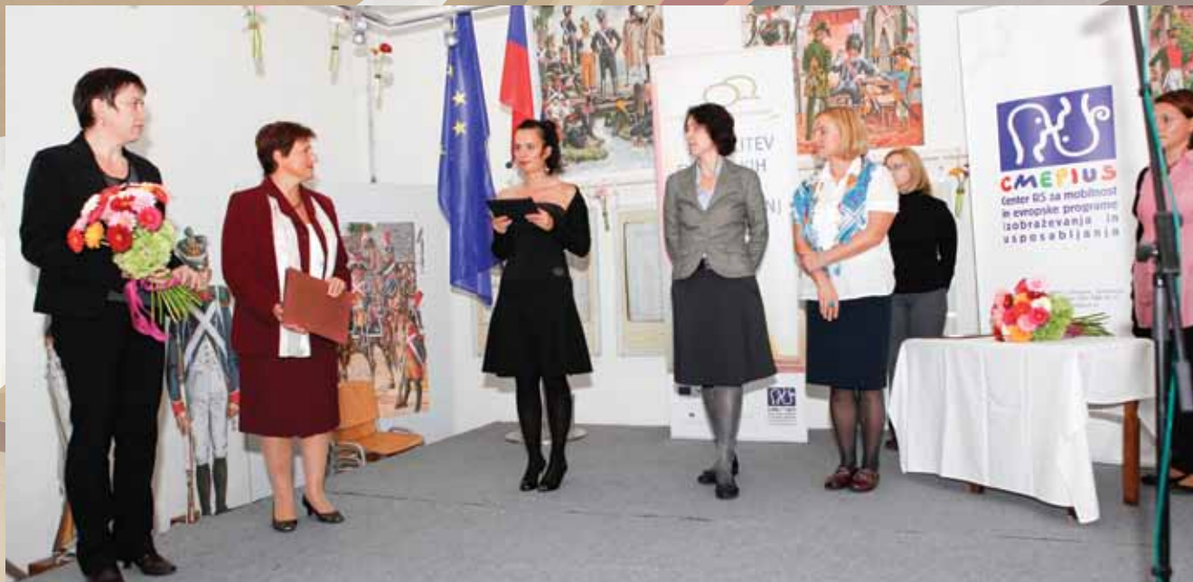
Podelitev Nacionalnih jezikovnih priznanj, Slovenski šolski muzej, Ljubljana, 27. 9. 2010