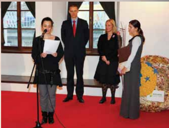
Podelitev Evropskih jezikovnih priznanj, Grad Fužine, Ljubljana, 2. 12. 2009

Učitelji in učenci, ki so sodelovali v projektu, so ustvarili avtorsko zgodnico in jo nato prevedli v 4 tuje jezike. Projekt vključuje jezik otrok tujcev, ki se šolajo na šoli VIZ II. Osnovna šola Rogaška Slatina in ki svoj materni jezik uporabljajo le v domačem okolju (predvsem hrvaščina in albanščina), v javnosti pa ne. S projektom so tako učenci imeli priložnost, da svoj jezik predstavijo širši javnosti, ga uporabijo pri prevajanju in okolico naučijo oz. seznanijo z njihovim jezikom.