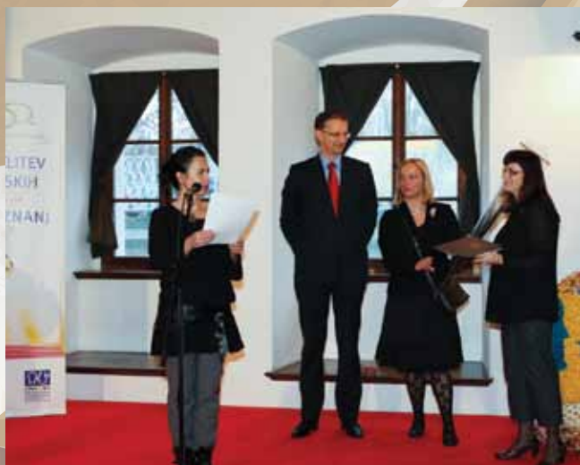
Podelitev Evropskih jezikovnih priznanj, Grad Fužine, Ljubljana, 2. 12. 2009

Turizem in potovanja postajajo v našem življenju vse pomembnejši. Zato predstavlja turistični sektor pomemben del gospodarstva v vseh evropskih državah, različne dejavnosti, povezane s turizmom, pa nudijo kvalifikacijo in prekvalifikacijo mladih, saj jim omogočajo sezonsko in celoletno zaposlitev.